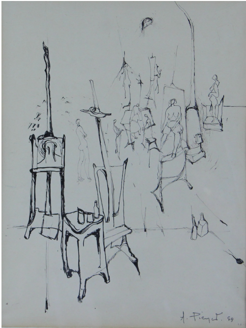
Tableau - "L'atelier"