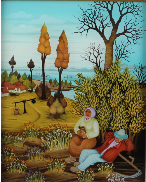
Tableau - "Le repos du paysan"