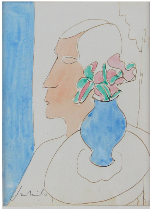
Tableau - "Le Bouquet"