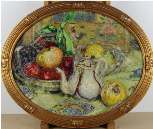
Tableau - "L'heure du thé"