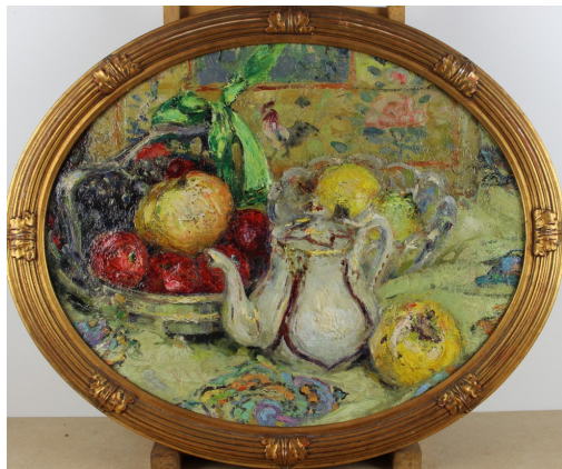
Tableau - "L'heure du thÃ©"