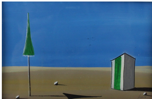
Tableau - "La cabine de plage"