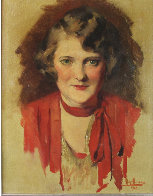
Tableau - "La femme en rouge"