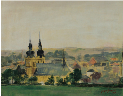
Tableau - "Eupen ville haute"