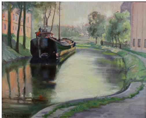
Tableau - "La PÃ©niche"