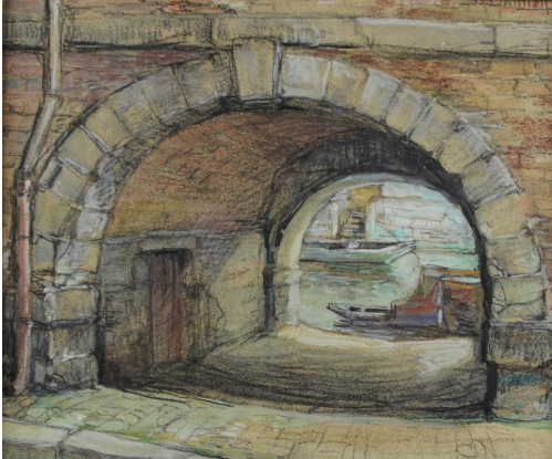
Tableau - "Namur passage vers le sambre"