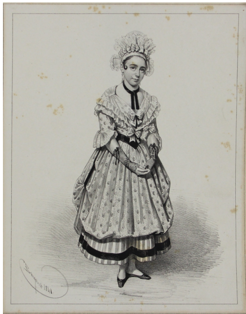
Tableau - "Femme en habit"