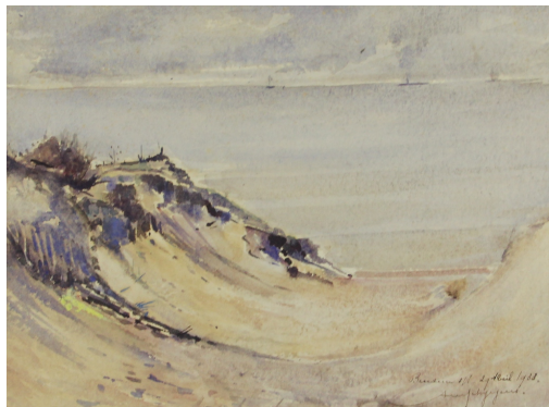
Tableau - "La Mer À Brenduin"