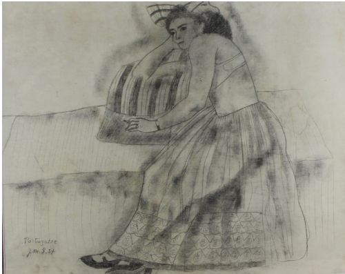
Tableau - "Portugaise"