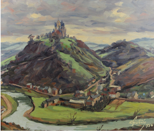
Tableau - "ChÃvremont"