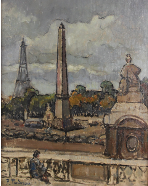
Tableau - "Jardin des tuileries"