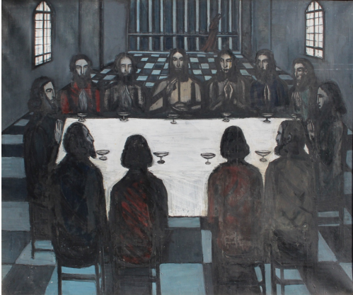
Tableau - "La dernière scène"