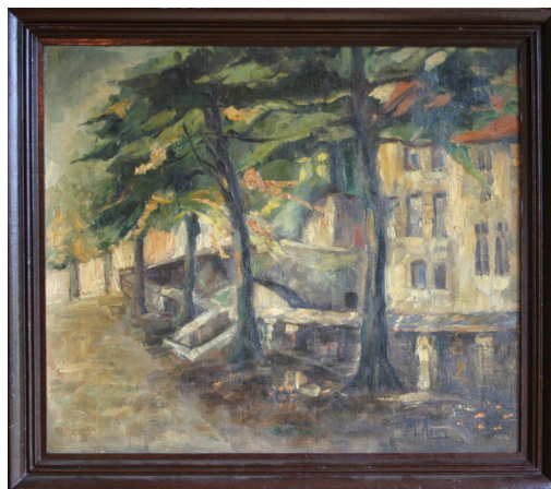
Tableau - "Le pont"