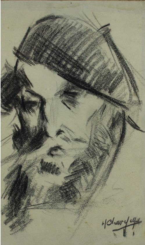
Tableau - "Autoportrait"