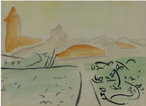
Tableau - "Saint Bertrand de Comminges"