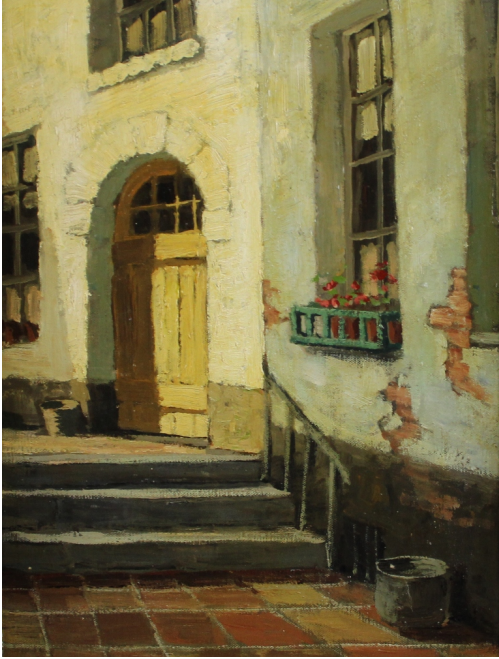
Tableau - "L'entr e 2"