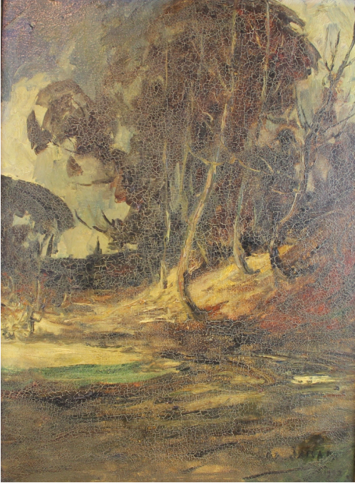
Tableau - "Le sous bois"