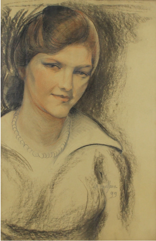
Tableau - "La femme au collier"