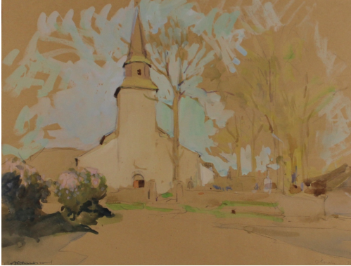
Tableau - "L'Église"