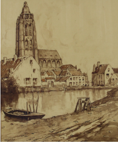
Tableau - "Ville en flandre"