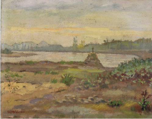
Tableau - "Le cours d'eau"