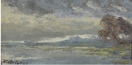
Tableau - "Paysage sur l'Å©tang"