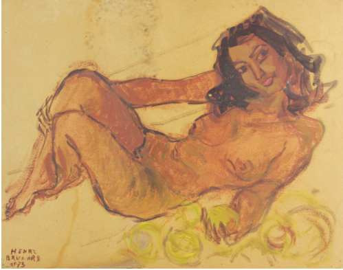
Tableau - "Nue aux fruits"