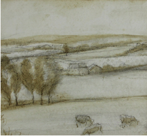
Tableau - "Paysage d'Ohain"