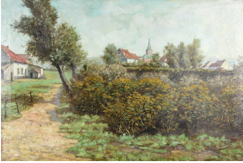
Tableau - "Le village"