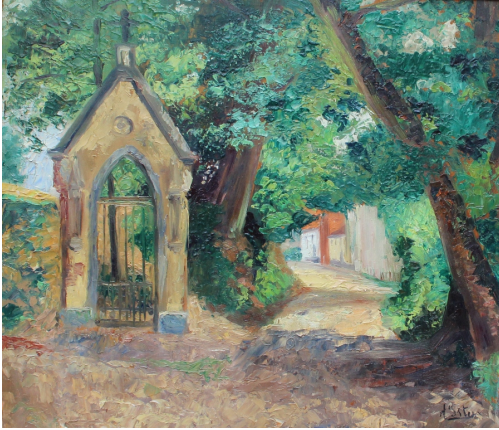
Tableau - "Le chemin de campagne"