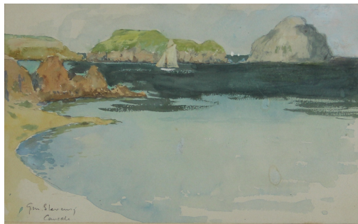
Tableau - "Vue de Cancale"