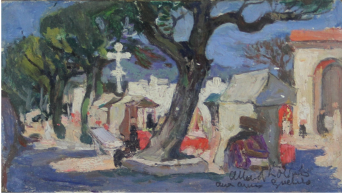
Tableau - "En Afrique"