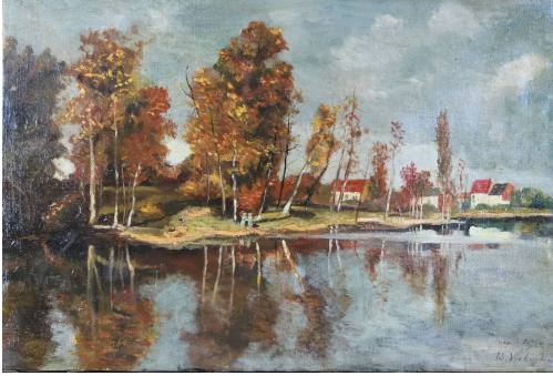
Tableau - "Promeneurs À l'Étang"