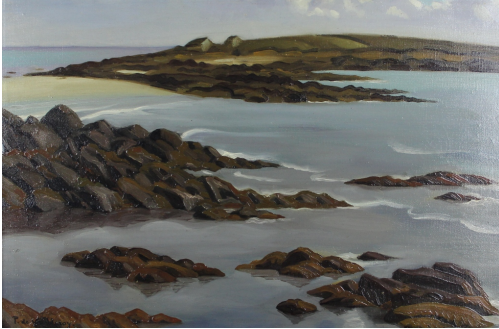
Tableau - "Ile de Raguenes (Bretagne)"