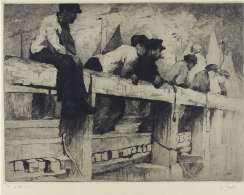
Tableau - "Les flâneurs"