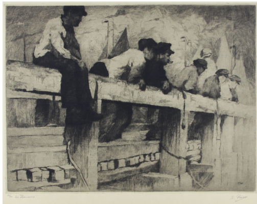
Tableau - "Les flâneurs"