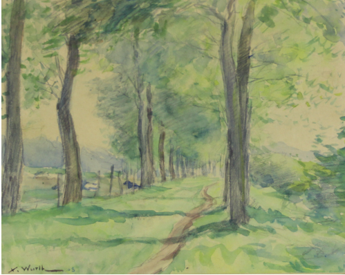
Tableau - "Paysage d'ardenne"