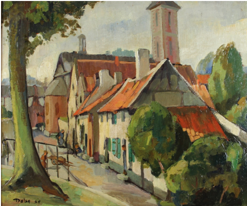
Tableau - "Journé à Maeseyck"