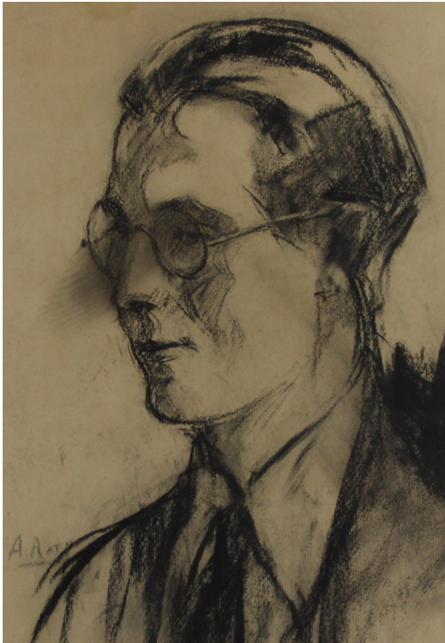
Tableau - "Portrait d'homme aux lunettes"