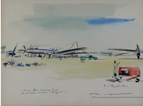
Tableau - "L'aéroport de Léopoldville"