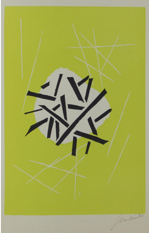
Tableau - "Sans titre"