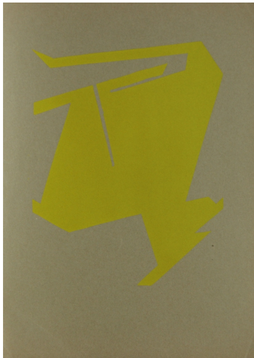
Tableau - "Sans titre"