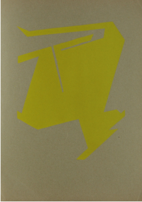
Tableau - "Sans titre"