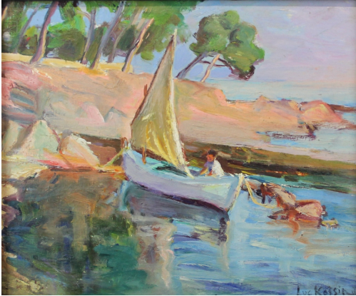
Tableau - "Martigues"