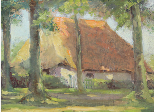
Tableau - "La chaumière"