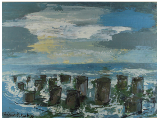
Tableau - "Le brise lame "