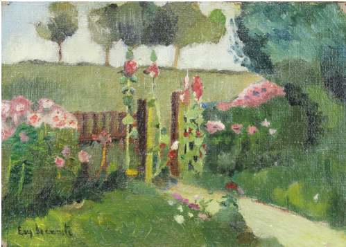
Tableau - "Le jardin fleuris"