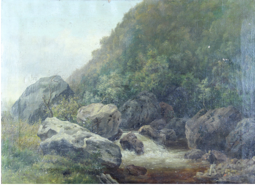
Tableau - "Le Pêcheur"