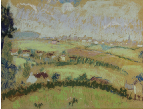
Tableau - "Paysage Wallon"