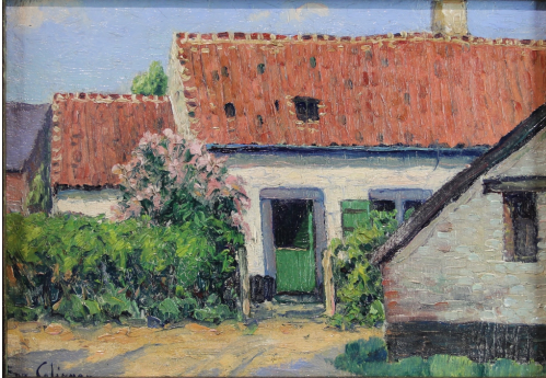
Tableau - "Le jardin fleuris"