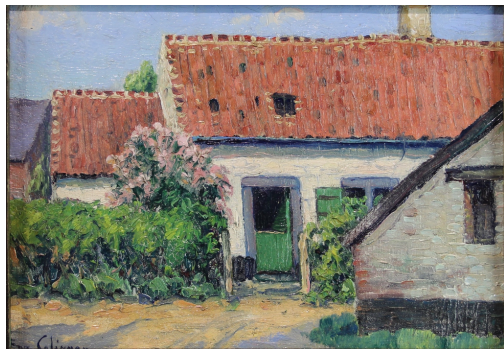
Tableau - "Le jardin fleuris"