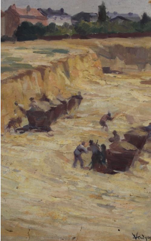
Tableau - "La récolte du sable"