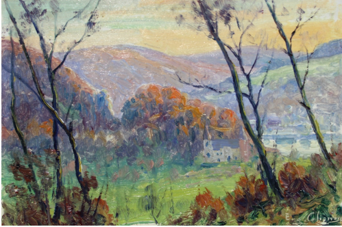
Tableau - "Vallée de la Meuse à Profondeville"