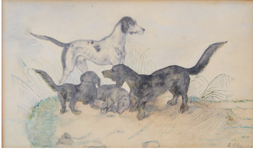
Tableau - "Les vagabonds"